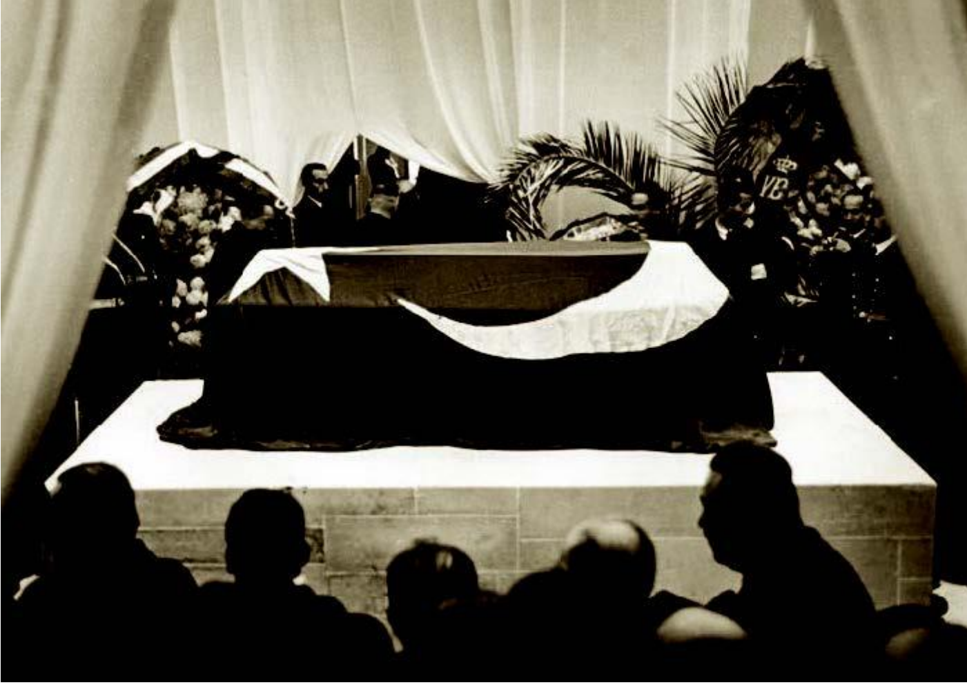
Atatürk'ün naaşı, Etnografya Müzesindeki yerine yerleştirildikten sonra, Ankara, 1938

Cenaze törenine bütün dünya devletleri özel temsilciler gönderdi. Çanakkale'de ve diğer muharebelerde ona karşı savaşmış yabancı generaller törende bilhassa dikkati çekiyordu. Atatürk'ün naaşı, 10 Kasım 1953 tarihinde yapılan büyük bir devlet töreni ile Etnografya Müzesi' ndeki geçici kabirden alınarak Anıtkabir'deki ebedî istirahatgâhına gömüldü.