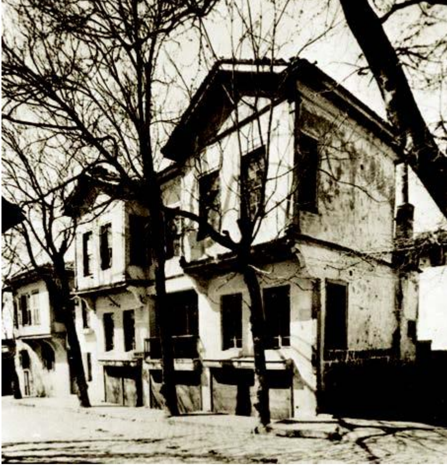
Mustafa Kemal Atatürk'ün doğduğu ev, Selanik

Mustafa Kemal Atatürk, 1881 yılında Selânik'te Kocakasım Mahallesi, Islâhhâne Caddesi'ndeki üç katlı pembe evde doğdu.