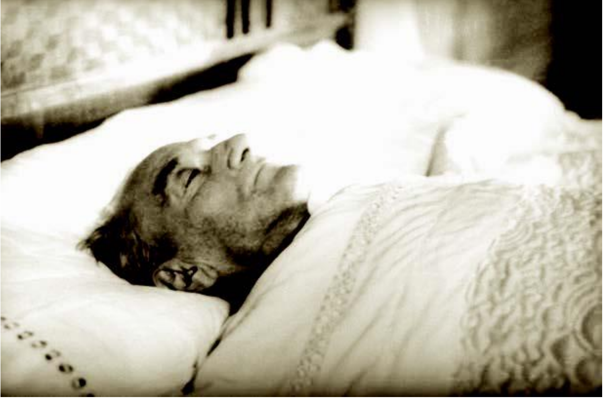
Dolmabahçe Sarayı, İstanbul, 1938

gözetiminde geçirdi. 10 Kasım 1938 Perşembe günü saat dokuzu beş geçe Dolmabahçe Sarayı'nda hayata gözlerini kapadı. Ölümü bütün dünyada derin akisler yaptı ve büyük üzüntü yarattı.