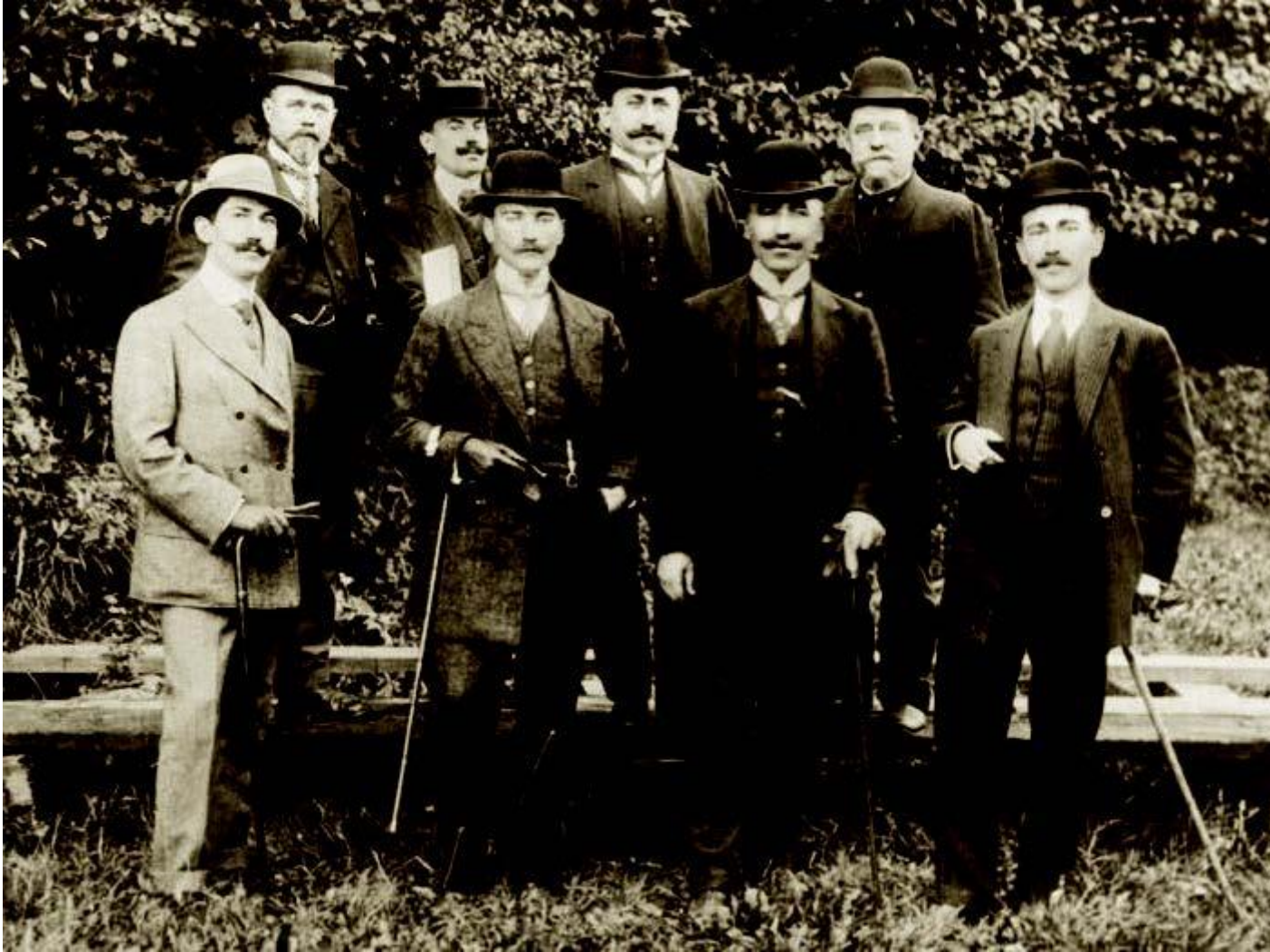
Picardie, Fransa, 1910

delegesi olarak katıldı. Bu kongrede ordunun siyasetten çekilmesini, cemiyetin halkın içindeki teşkilatını genişleterek millete dayanan bir siyasi parti hâline getirilmesini savundu. Görüşlerinin cemiyetin önde gelenlerince paylaşılmaması nedeniyle, kendini cemiyetten uzak tutarak askerî görevine verdi. Mustafa Kemal 2. Redif Tümeni Kurmay Başkanlığından yeniden 3. Ordu karargâhına atandı. Mayıs 1910'da, Arnavutluk'ta çıkan isyanı bastırmak üzere düzenlenen harekâтта, Harbiye Nazırı Mahmut Şevket Paşa'nın yanında görev aldı. 6 Eylül 1910'da Mustafa Kemal'in, 3. Ordu Subay Talimgâhı Komutanlığına ataması yapıldı. Mustafa Kemal bu görevde iken orduyu temsilen aralarında Fethi Bey'in de bulunduğu bir kurul ile birlikte Fransa'daki Picardie manevralarına katıldı. 1911 yılında İstanbul'da Genel Kurmay Başkanlığı emrinde çalışmaya başladı.