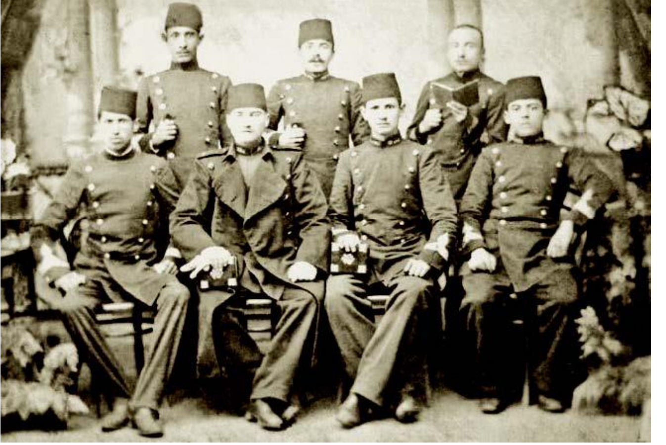
Mustafa Kemal Mekteb-i Harbiye'de, İstanbul, 1901

1903 yılında ikinci sınıfa geçerek üsteğmenliğe yükseldi. 11 Ocak 1905'te yüzbaşı rütbesiyle Harp Akademisinden mezun oldu.