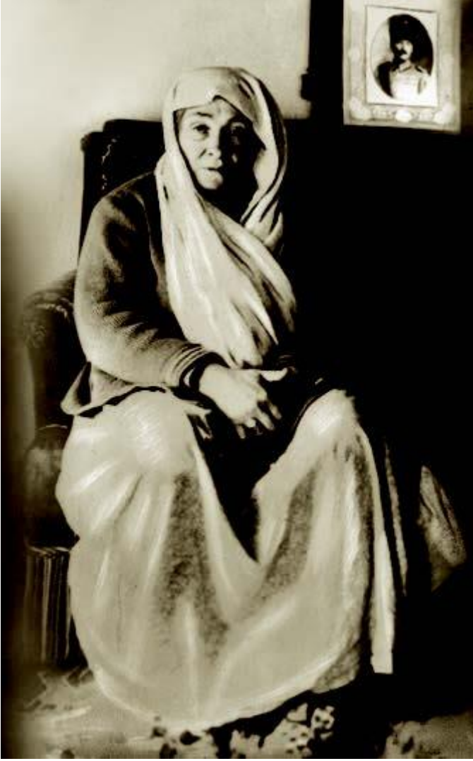
Annesi Zübeyde Hanım

Küçük Mustafa, öğrenim çağına gelince annesinin arzusu üzerine Hafız Mehmet Efendi 'nin mahalle mektebinde ilköğrenimine başladı. Kısa bir süre sonra babasının isteğiyle devrinin şartlarına göre modern eğitim veren Şemsi Efendi Mektebine geçti . Bu sırada babasını kaybetti. Bir süre Rapla Çiftliği 'nde dayısının yanında kaldıktan sonra Selânik'e dönüp okulunu bitirdi. Selânik Mülkiye Rüştiyesine kaydoldu ve kısa bir süre sonra, 1893 yılında, Selanik Askerî Rüştiyesine girdi. Çok sevdiği matematik dersinin öğretmeni Yüzbaşı Mustafa Efendi'den, " Kemal " adını aldı. Böylece adı " Mustafa Kemal " oldu. Selanik Askerî Rüştiyesini bitirdikten sonra 1896 yılında Manastır Askerî İdadisine başladı. Edebiyata olan ilgisi, onda gelecekteki hitabet ve yazılı anlatım ustalığının temelini oluşturdu. Manastır Askerî İdadisindeki tarih öğretmeni Kolağası Mehmet Tevfik Bey, Mustafa Kemal'in tarihe ve özellikle Türk tarihine ilgi duymasında başlıca etken oldu. 1896-1899 yıllarında Manastır Askerî İdadisini bitirip, İstanbul'da Harp Okulu'nun piyade sınıfına yazıldı. Bu okuldaki öğrenciliği sırasında arkadaşlarıyla birlikte hürriyet fikirlerini yaymak amacıyla gizli olarak el basması bir gazete çıkardı. 1902 yılında Harp Okulundan teğmen rütbesiyle mezun olarak Harp Akademisine girdi.