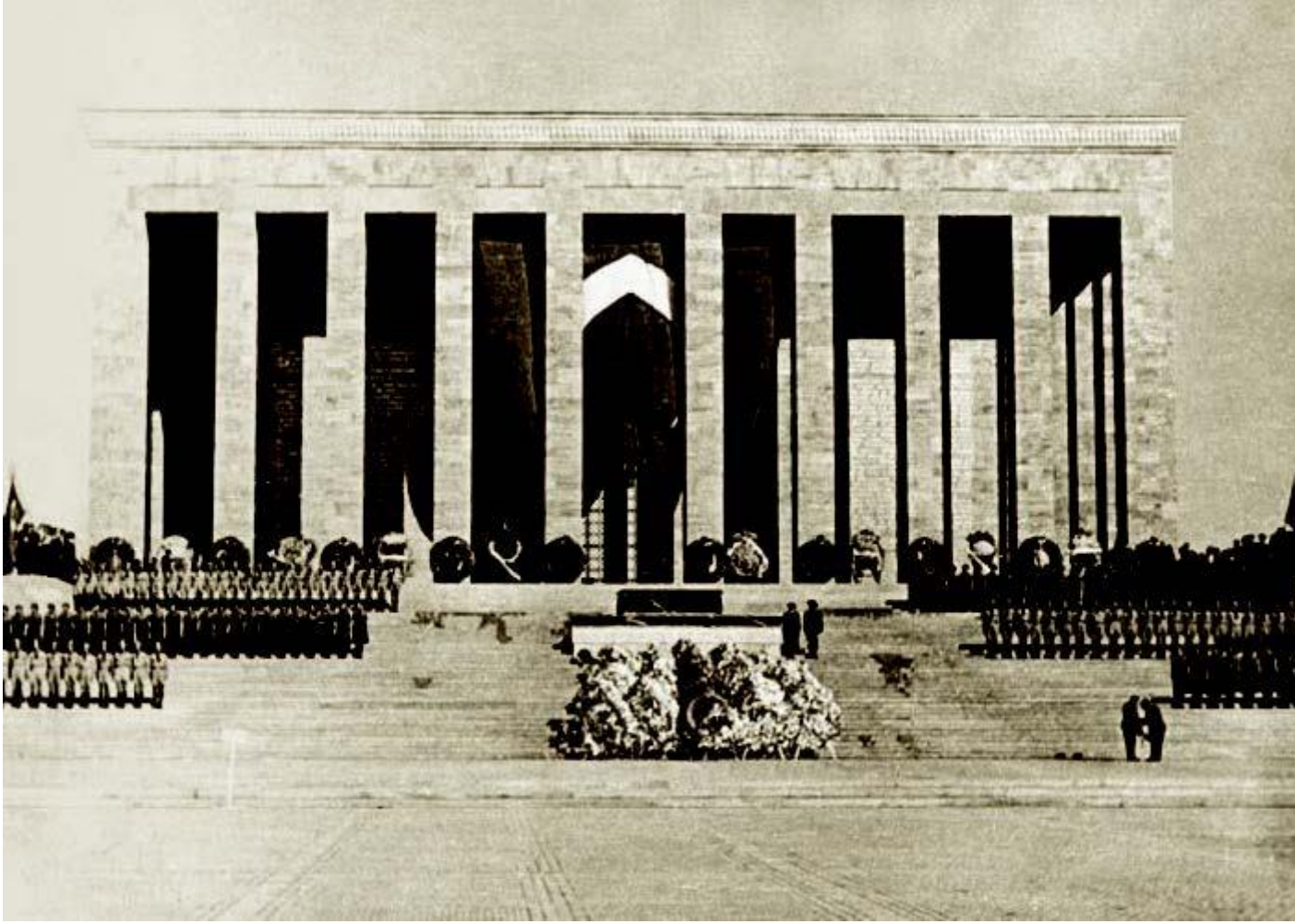
Atatürk'ün naşı hitabet kürsüsünde, Ankara, 1953